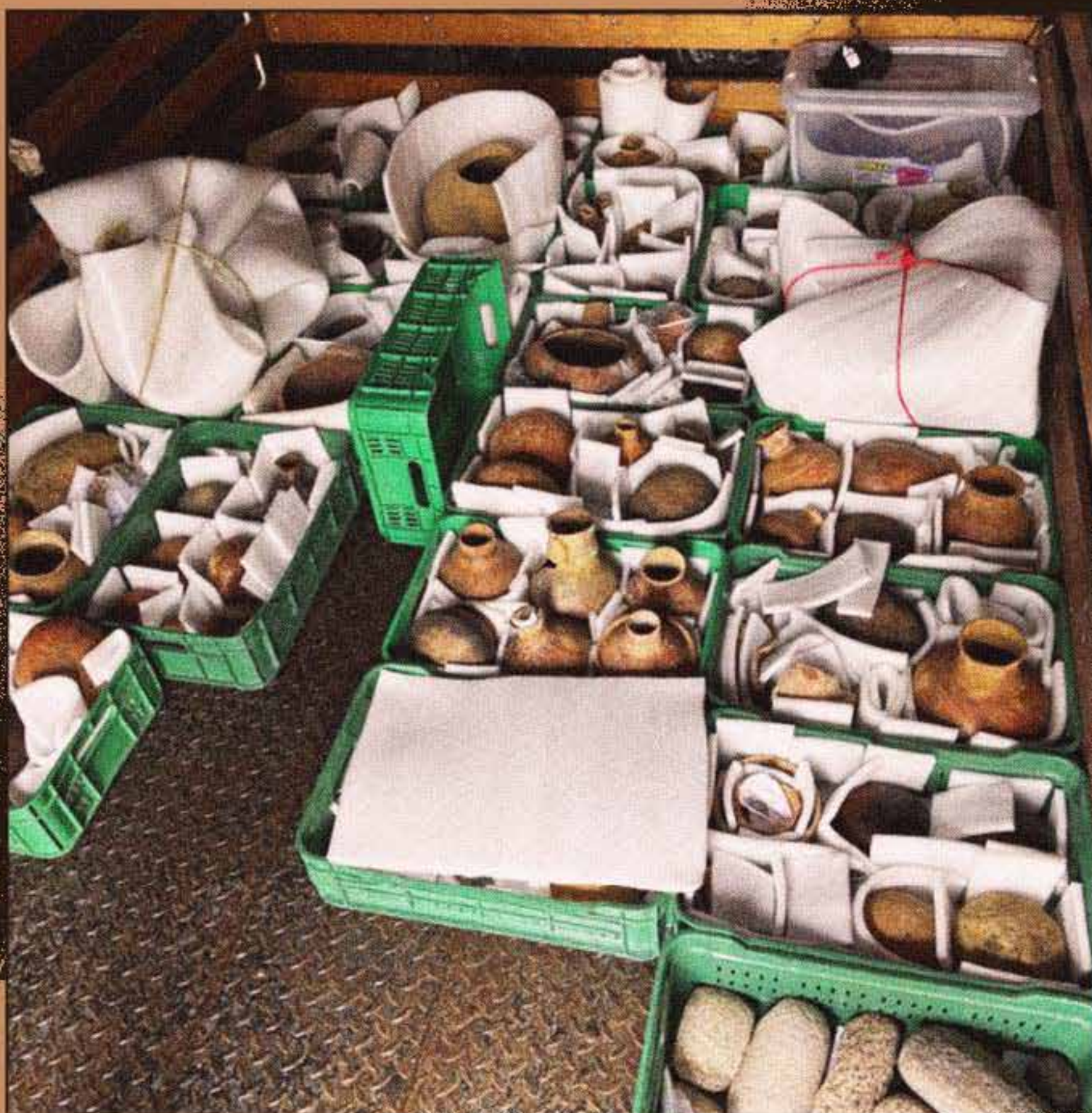
● Foto: Piezas incautadas en abril de 2025 a gUAQUEROS tiktokers. ICANH

Solo en 2025, el ICANH recibió 137 reportes de afectaciones* al patrimonio arqueológico. Entre estas están las denuncias por los gUAQUEROS tiktokers, quienes enfrentaron un proceso judicial.