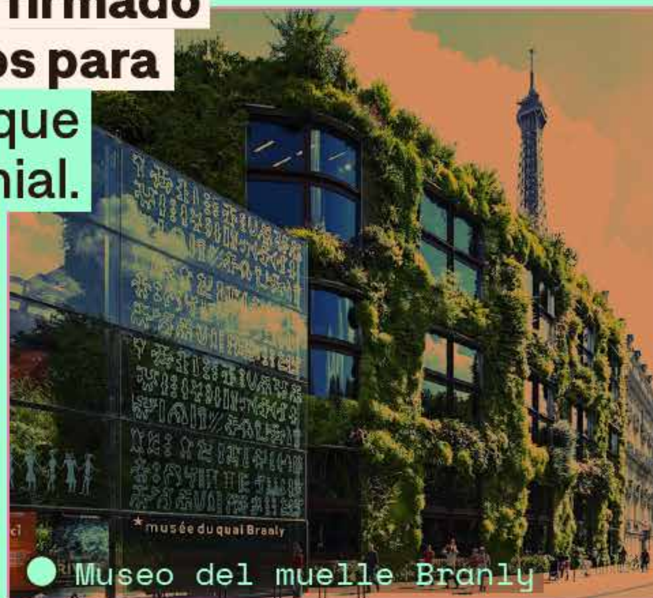
● Museo del muelle Branly