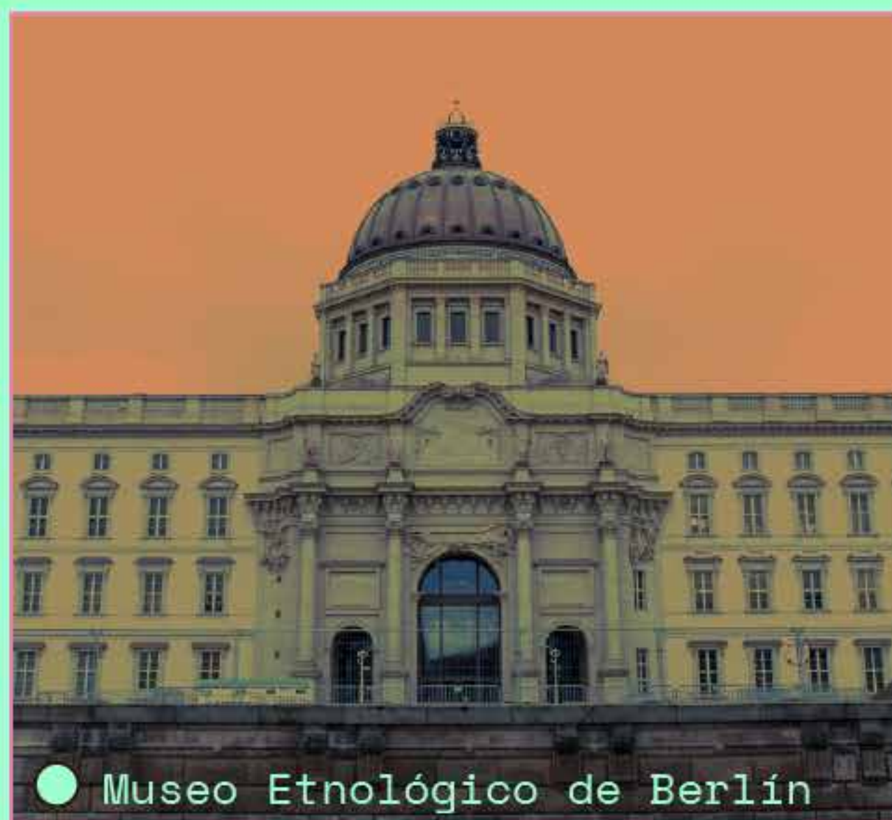
● Museo Etnológico de Berlín