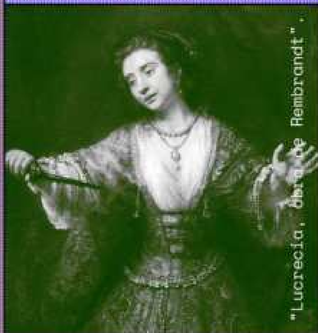
“Lucrecia, obra de Rembrandt”.

Los hombres violan con “un falso deseo”, como lo llamó Shakespeare en su poema “La violación de Lucrecia”.