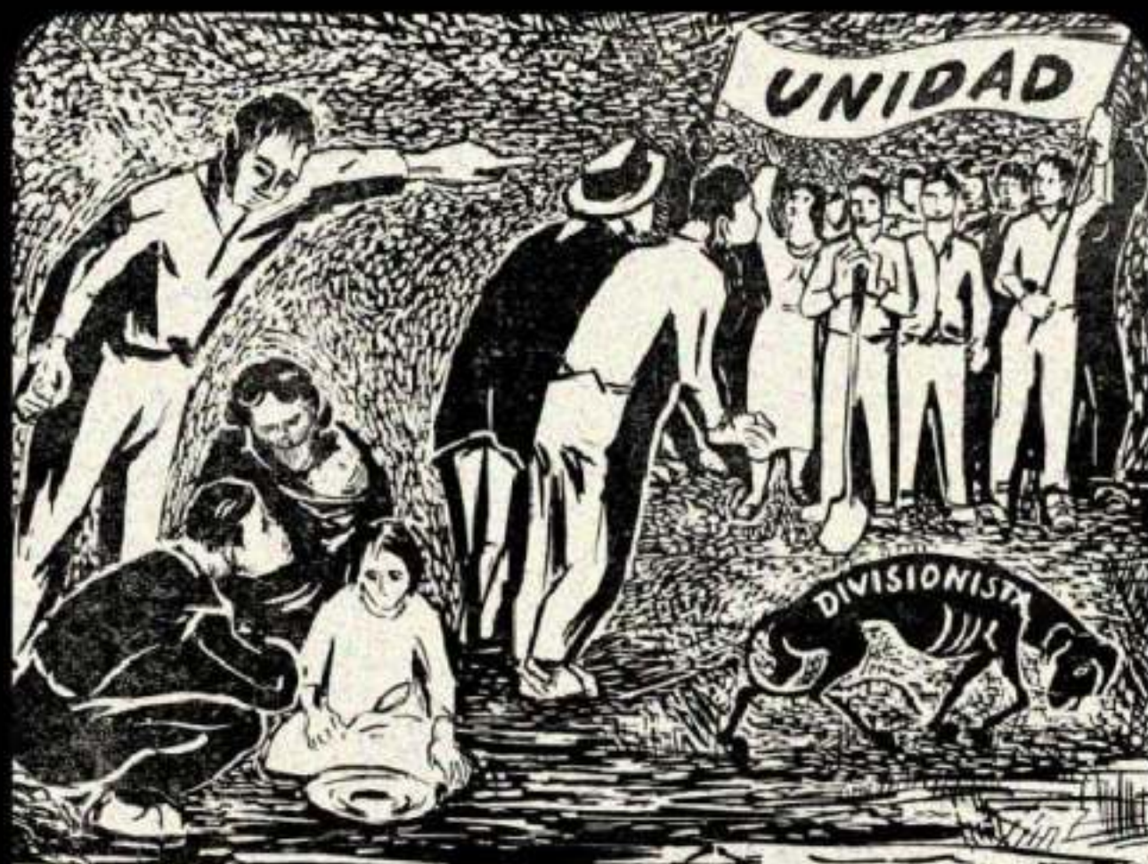
Ante la Creciente Miseria del Pueblo, el único Camino es la Unidad

Sin embargo, más de cinco décadas de conflicto armado interno en Colombia han dejado aproximadamente 15,481 violaciones de derechos humanos a personas sindicalizadas, desde la década de 1970 hasta el 2021, con más de 3,295 homicidios.